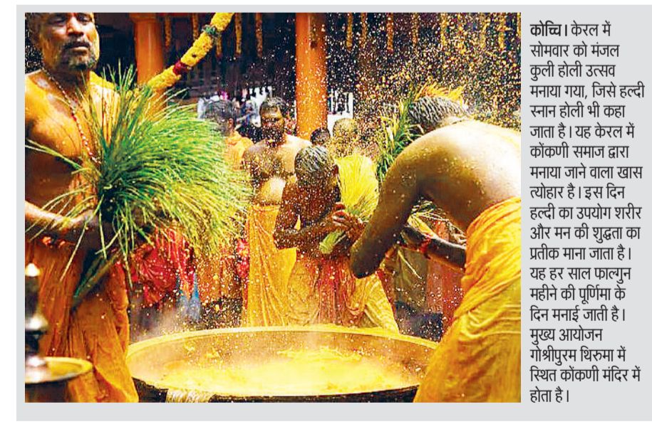
कोच्चि। केरल में सोमवार को मंजल कुली होली उत्सव मनाया गया, जिसे हल्दी राना होली भी कहा जाता है। यह केरल में कोंकणी समाज द्वारा मनाया जाने वाला खास त्योहार है। इस दिन हल्दी का उपयोग शरीर और मन की शुद्धता का प्रतीक माना जाता है। यह हर साल फाल्गुन महीने की पूर्णिमा के दिन मनाई जाती है। मुख्य आयोजन गोश्रीपुरम थिरुमा में स्थित कोंकणी मंदिर में होता है।