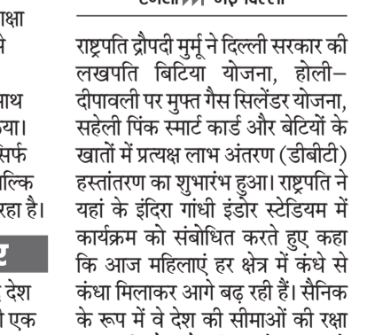
एजेसी ► नई दिल्ली राष्ट्रपति द्रौपदी मुर्मू ने दिल्ली सरकार की लखपति बिटिया योजना, होली-दीपावली पर मुफ्त गैस सिलेंडर योजना, सहैली पिक स्मार्ट कार्ड और बेटियों के खातों में प्रत्यक्ष लाभ अंतरण (डीबीटी) हस्तांतरण का शुभारंभ हुआ। राष्ट्रपति ने यहां के इंदिरा गांधी इंडोर स्टेडियम में कार्यक्रम को संबोधित करते हुए कहा कि आज महिलाएं हर क्षेत्र में कंधे से कंधा मिलाकर आगे बढ़ रही हैं। सैनिक के रूप में वे देश की सीमाओं की रक्षा कर रही हैं। वैज्ञानिक के रूप में प्रयोगशालाओं में शोध कर रही हैं। खेल प्रतियोगिताओं में अंतरराष्ट्रीय मंचों पर भारत का तिरंगा लहरा रही हैं।