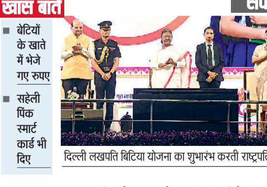
दिल्ली लखपति बिटिया योजना का शुभारंभ करती राष्ट्रपति मुर्मू

राष्ट्रपति मुर्मू ने कहा कि महिलाओं को शिक्षित बनाना, उनका आत्मविश्वास बढ़ाना और उनको प्रोत्साहन एवं सहयोग देना, हम सबका कर्तव्य है। हमें अपनी बेटियों को यह विश्वास दिलाना है कि वे सपने देखने और उन्हें पूरा करने की क्षमता रखती हैं तथा हम उनके सपनों को साकार करने में उनके साथ खड़े हैं। यदि महिलाएं सुरक्षित, शिक्षित, और आत्मनिर्भर होंगी, हर क्षेत्र में आत्मविश्वास के साथ नेतृत्व प्रदान करेंगीं तब पूरे देश में सकारात्मक संदेश जाएगा।