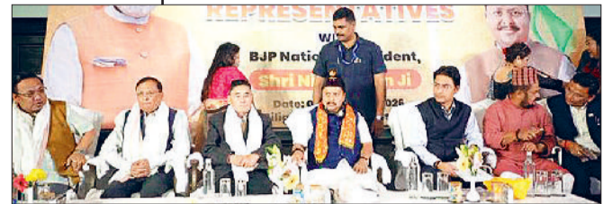
सिलीगुड़ी के कार्यक्रम में भाजपा अध्यक्ष नितिन नबीन