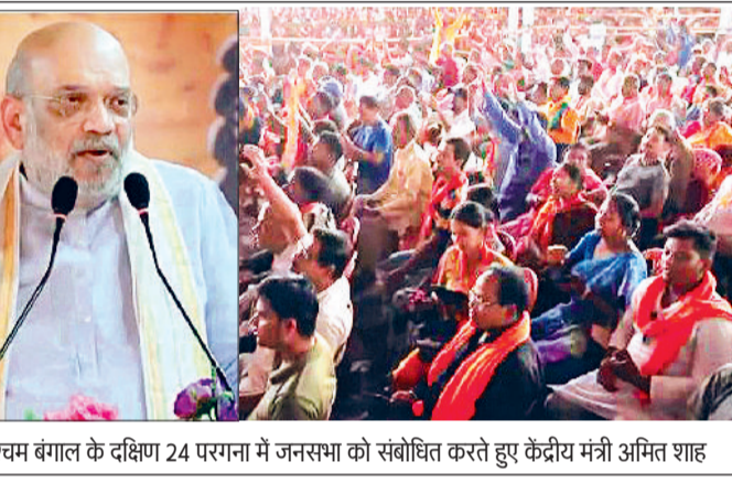
पश्चिम बंगाल के दक्षिण 24 परगना में जनसभा को संबोधित करते हुए केंद्रीय मंत्री अमित शाह

बाष्टाचारी पूर्व डीजीपी को राज्यसभा भेजा जा रहा 7वें वेतन आयोग के अनुसार कर्मचारियों को वेतन देगे