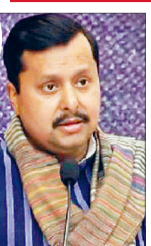
भाजपा अध्यक्ष नितिन नबीन

भाजपा अध्यक्ष ने कहा कि राज्य में तुणमूल कांग्रेस (टीएमसी) की सरकार सीमा पर बाड़ लगाने के लिए जमीन नहीं दे रही है, क्योंकि सीएम ममता बेनर्जी देश के नागरिकों की सुरक्षा नहीं करना चाहतीं। नवीन ने दावा किया कि अगर चुनाव आयोग 50 लाख बांग्लादेशियों के नाम मतदाता सूची से नहीं हटाता, तो केंद्र सरकार की कल्याणकारी योजनाओं का लाभ घुसपैठियों को मिलता। उन्होंने कहा कि यह राज्य के वास्तविक लाभार्थियों के साथ अन्याय होता।