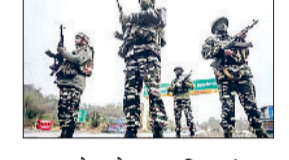
चुनाव के मद्देनजर पश्चिम बंगाल में सुरक्षा व्यवस्था को सुदृढ़ करने के लिए निर्वाचन आयोग ने केंद्रीय अर्द्धसैनिक बलों की तैनाती का अंतिम खाका जारी कर दिया है।

दूसरे चरण की तैनाती के तहत राज्य के विभिन्न जिलों में कुल 480 कंपनियों को चरणबद्ध तरीके से तैनात किया जा रहा है। आयोग के अनुसार 10 मार्च से कई जिलों में अतिरिक्त कंपनियां सक्रिय हो जाएंगी। पहले चरण में 280 कंपनियां पहले ही राज्य के अलग-अलग जिलों में तैनात की जा चुकी हैं। अब शेष 280 कंपनियों का भी जिला-वार आवंटन तय कर दिया गया है। राज्य में सबसे अधिक केंद्रीय बलों की तैनाती उत्तर 24 परगना में की जा रही है। यहां तीन पुलिस जिलों और दो पुलिस कमिश्नरेंट क्षेत्रों को मिलाकर 10 मार्च से कुल 58 कंपनियां तैनात होंगी।