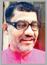
(नैतिकता वरिष्ठ शिक्षिका हैं, ये उनके अपने विचार हैं।)